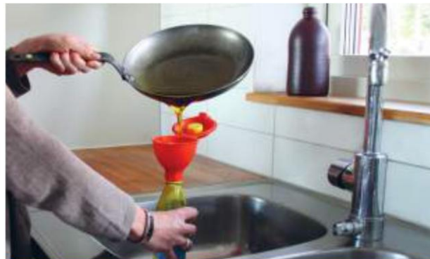
Lätt och rätt med använt fett.